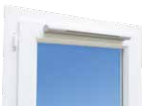
Páraszabályozott légbevezető nyílászáróba építve

A rendszer tökéletes és harmonikus működése érdekében érdemes itt is páraszabályozott, és/vagy mozgásérzékelővel kombinált légelvezető elemeket(2) alkalmazni. A konyhába biztonsági okokból tűzvédelmi légszelepek beépítése javasolt.