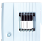
Páraszabályozott mozgásérzékelős légelvezető