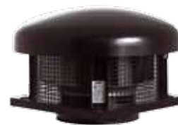
VBV (230 V, 66 Wh)